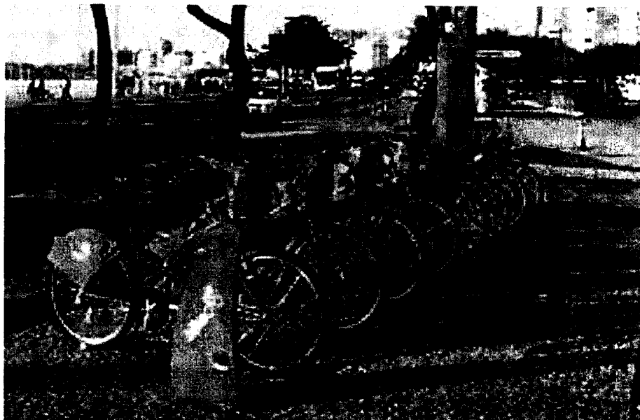
(Modelo de bicicletário)

O Vereador infrafirmado, nos termos do Regimento Interno desta Câmara Municipal, vem requerer que uma vez aprovado pelo Plenário desta Casa de Leis, seja encaminhado ofício ao Excelentíssimo Senhor Prefeito Municipal, com cópia da presente, sugerindo-lhe que envie esforços, junto ao órgão municipal competente no sentido de que seja “instalado bicicletário ou paraciclo em frente à Escola Municipal 9 de maio”.